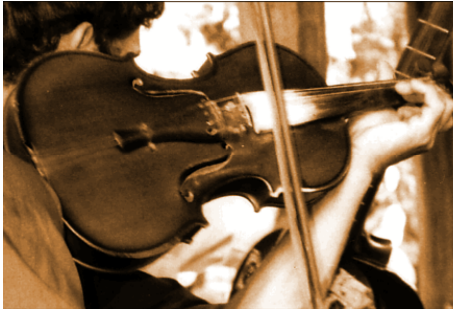
Violon préparé de l'Oach

Le colloque se déroule dans la salle D.026 (bâtiment D) de l'université Paul Valéry. Le concert a lieu au Théâtre de la Vignette (université Paul Valéry). Université Paul Valéry : Route de Mende, Montpellier.